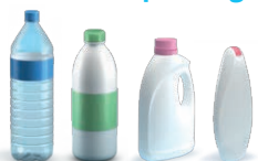
Plastic flessen en flacons